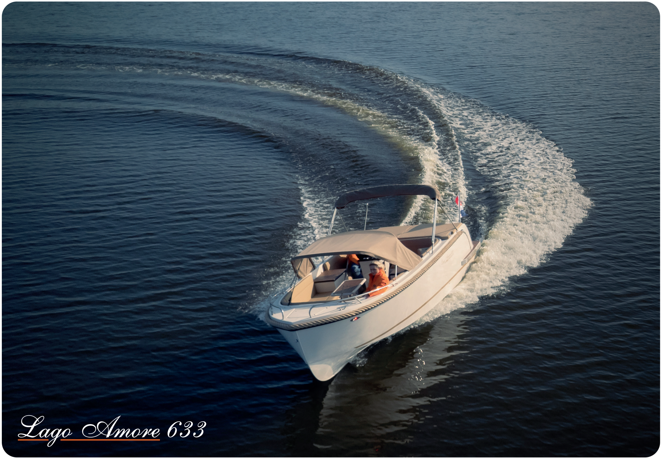
Lago Amore 633